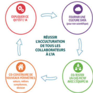
Plan d'action pour réussir l'acculturation de tous les collaborateurs à l'IA

Pour conclure, l'erreur à ne pas commettre serait d'instaurer un nouveau type de segmentation du travail entre les robots (et les solutions d'IA) et les hommes (qui les superviseraient). Si ce scénario existe il doit être complété par la mise en place d'une culture créée sur la collaboration